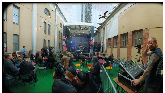
Takapiha ja tilapäinen lava tapahtumakäytössä

Aulasta on käynnit ulos, saliin, lämpiöön sekä wc-tiloihin .