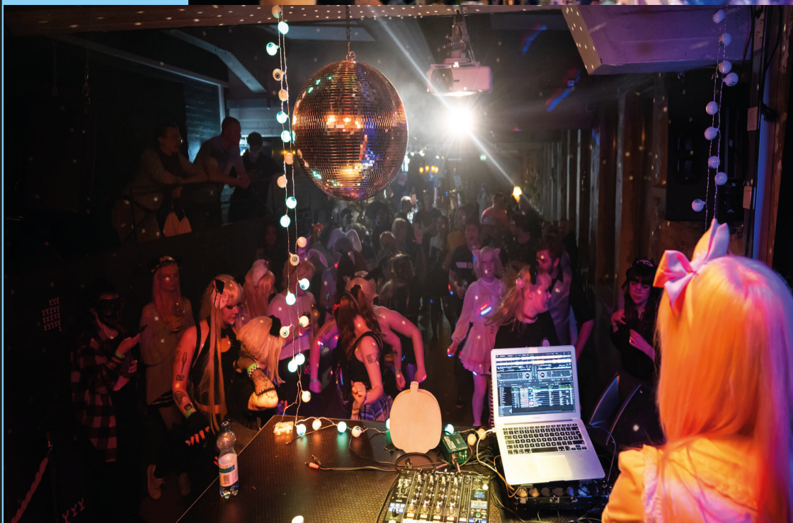
Lämpio päivällä ja yöllä